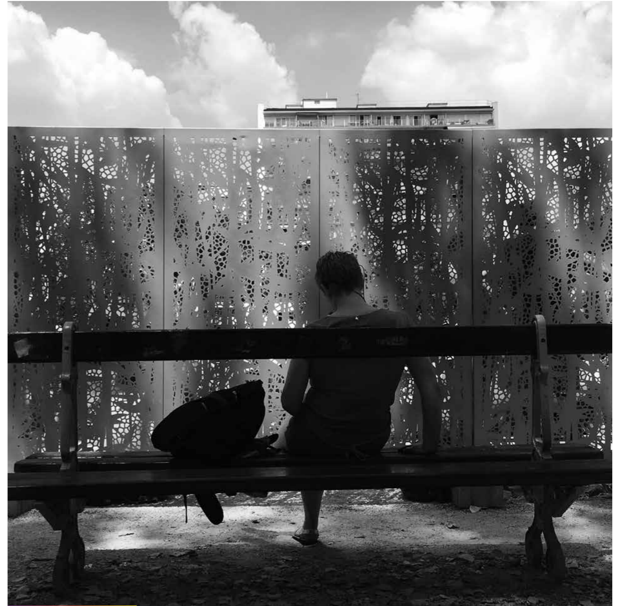
Building en vue.