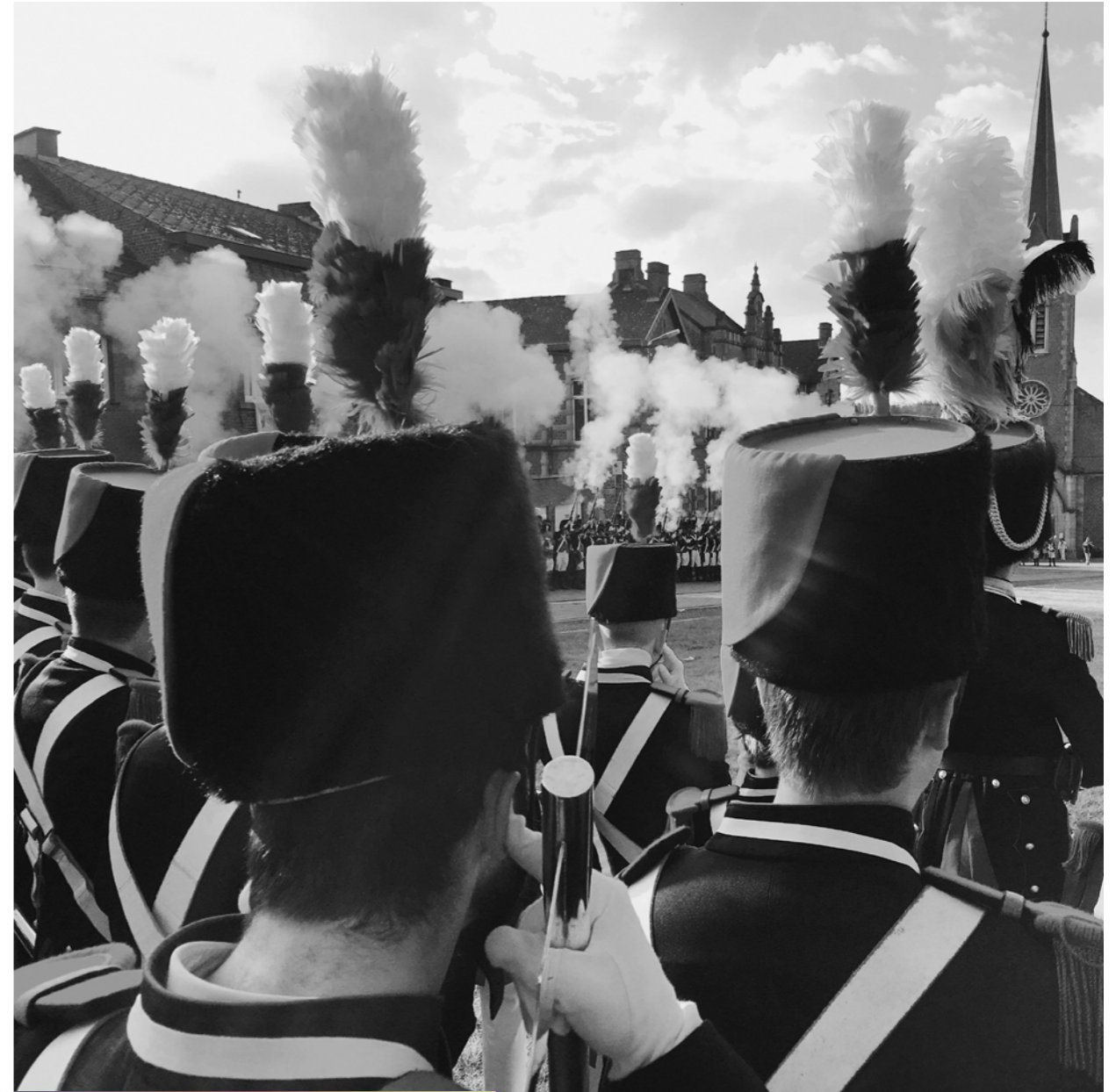
Y a pas de fumée sans (coups de) feu.