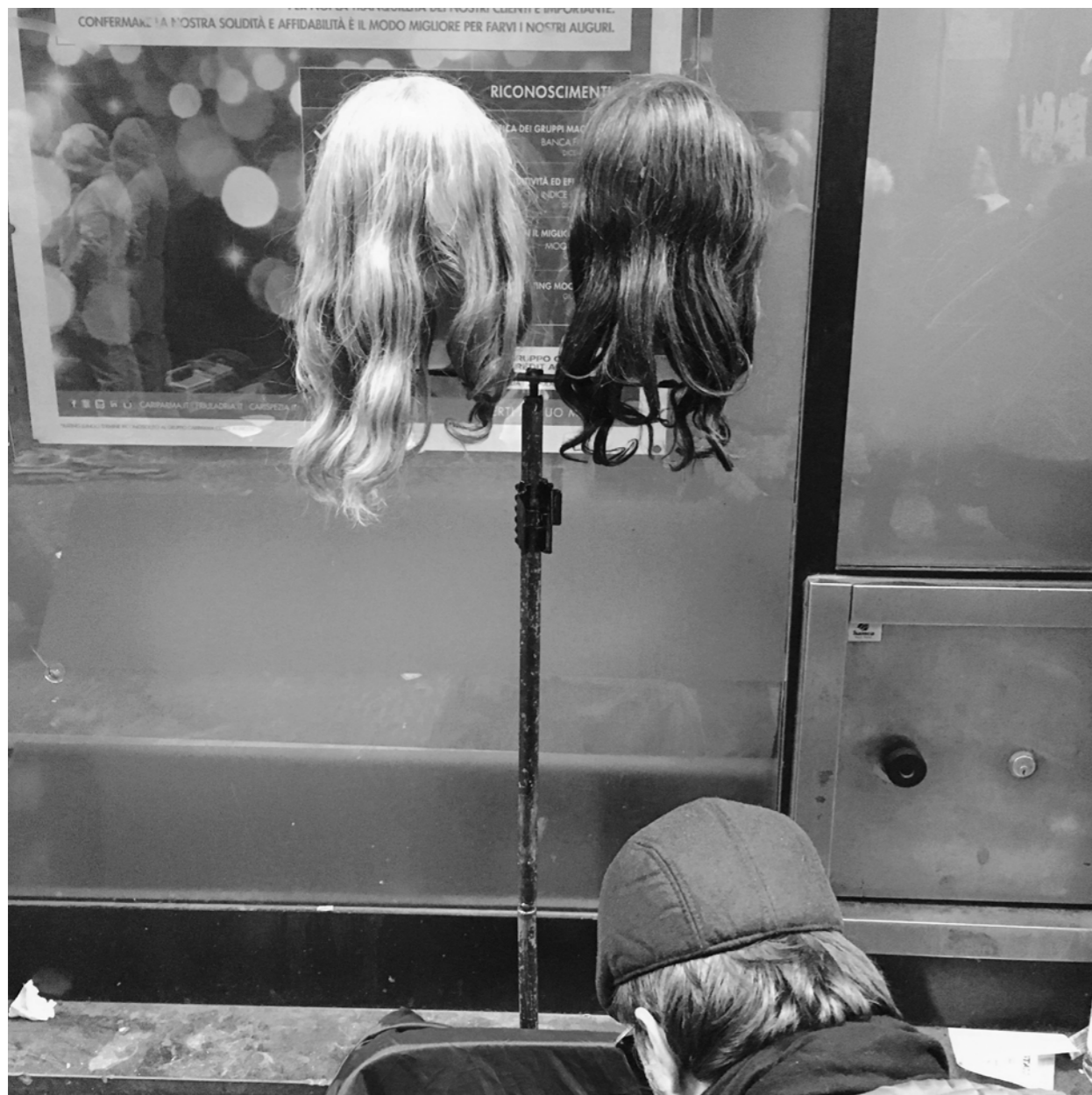
Twin hairstyle [ Coupe jumelle ].