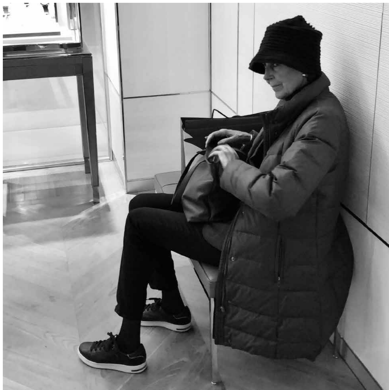
Relais-chapeau (au Bon Marché).