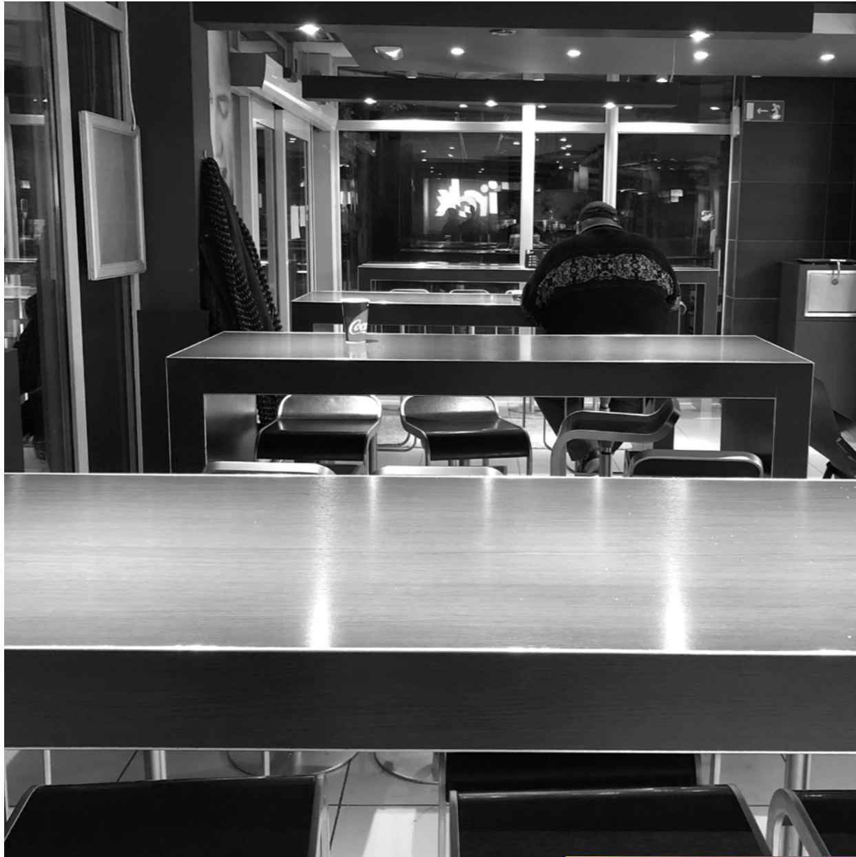
Sad food [ Triste nourriture ].