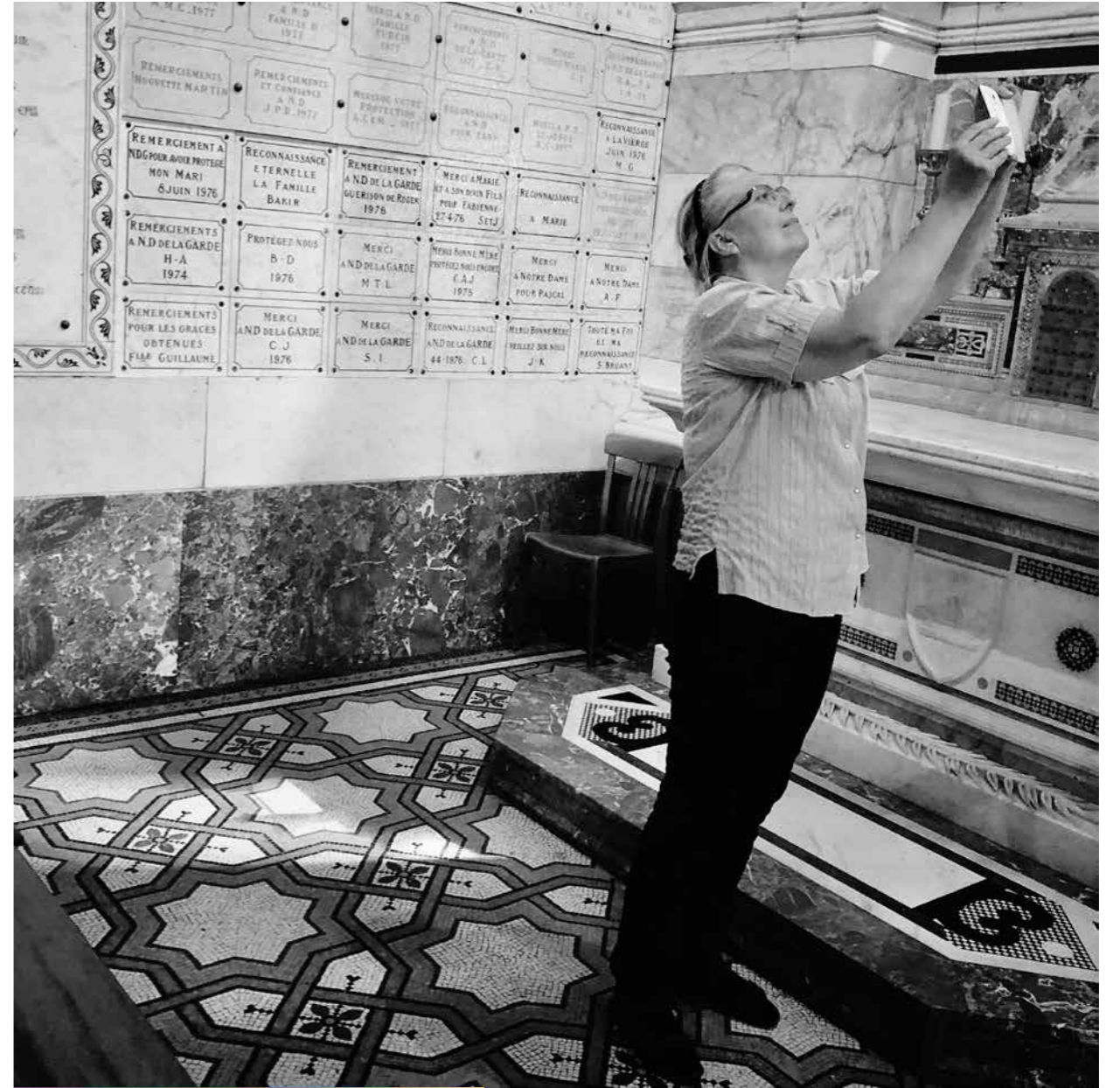
Selfie morbide - Bougez pas derrière!