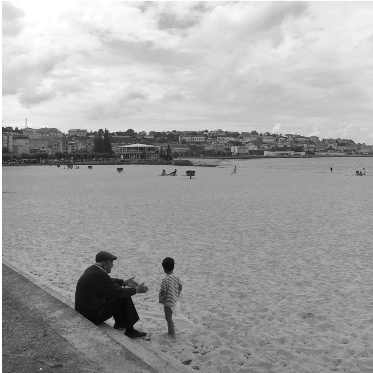
Le vieil homme et la mer (au fond à droite).