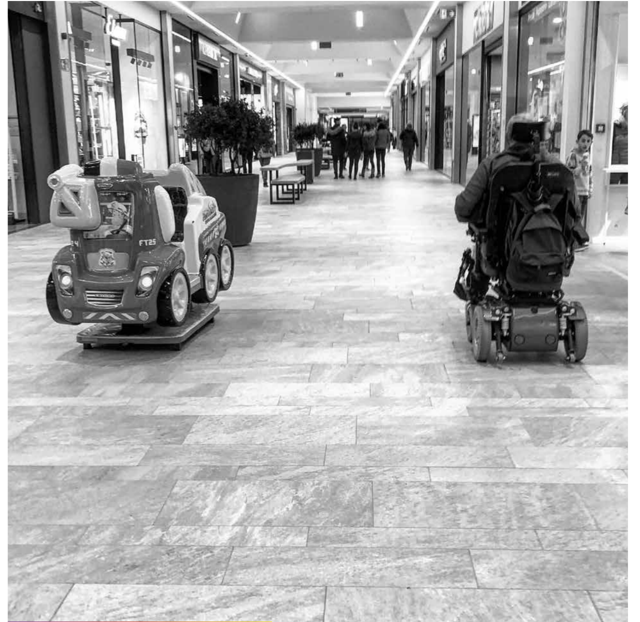
Deux façons de bouger sans bouger.