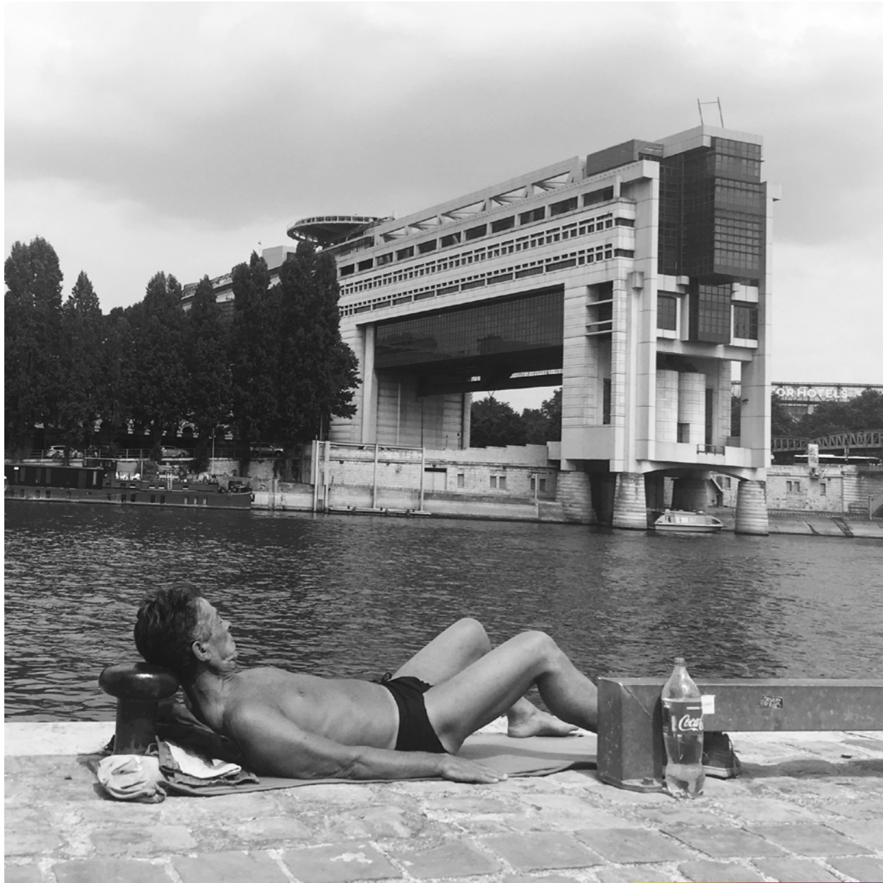
Sur les pavés, la plage.