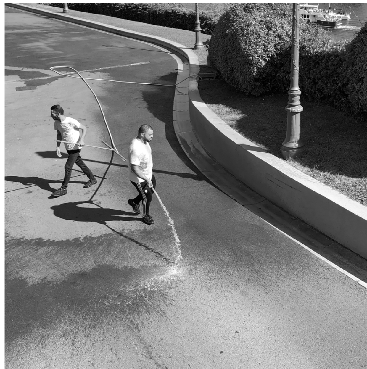
Sobriété sur la route. Par forte chaleur, elle ne boit que de l'eau.