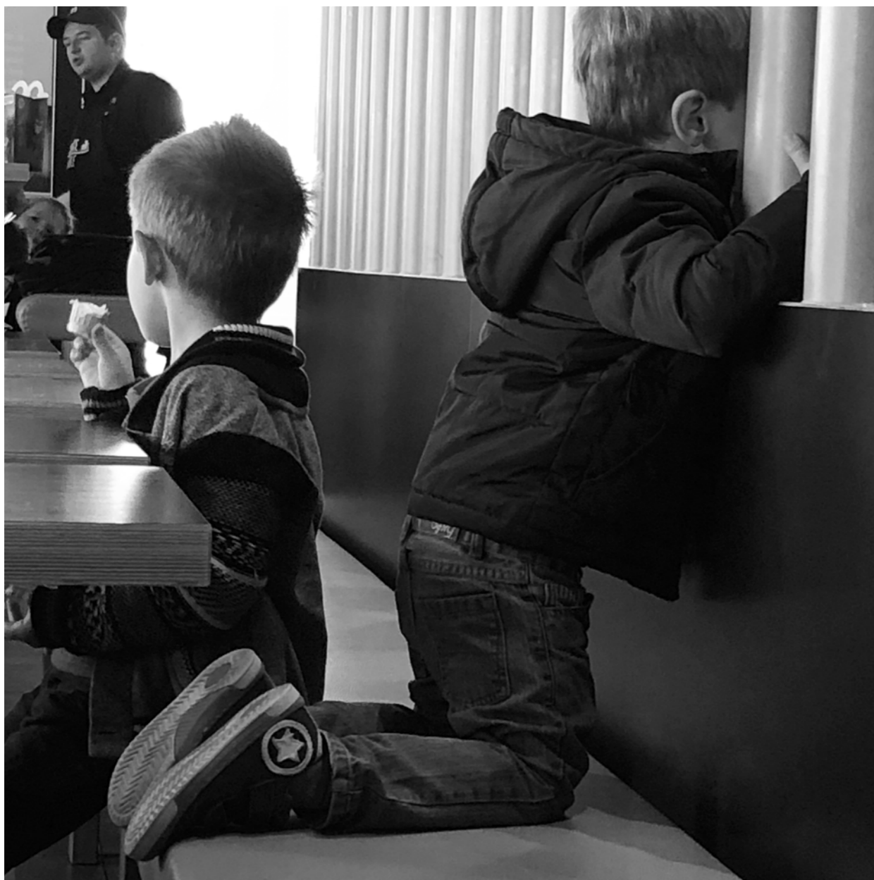
- Je compte jusque quand?... Jusque quand j'ai fini!