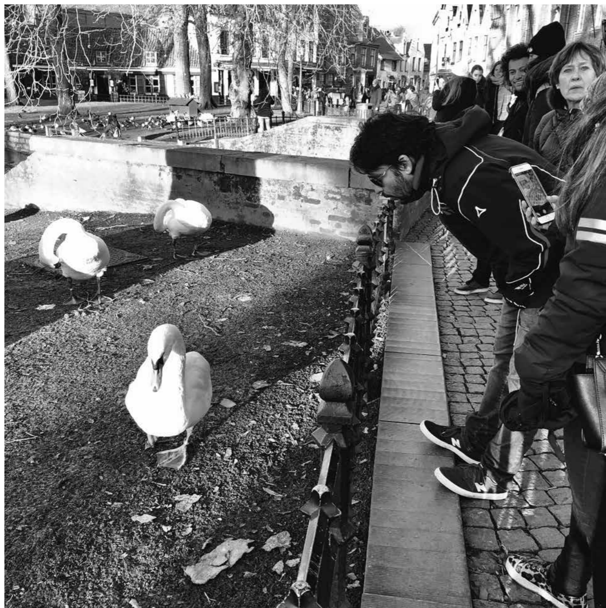
- Coin coin... glou glou... pouet pouet... bon ok.