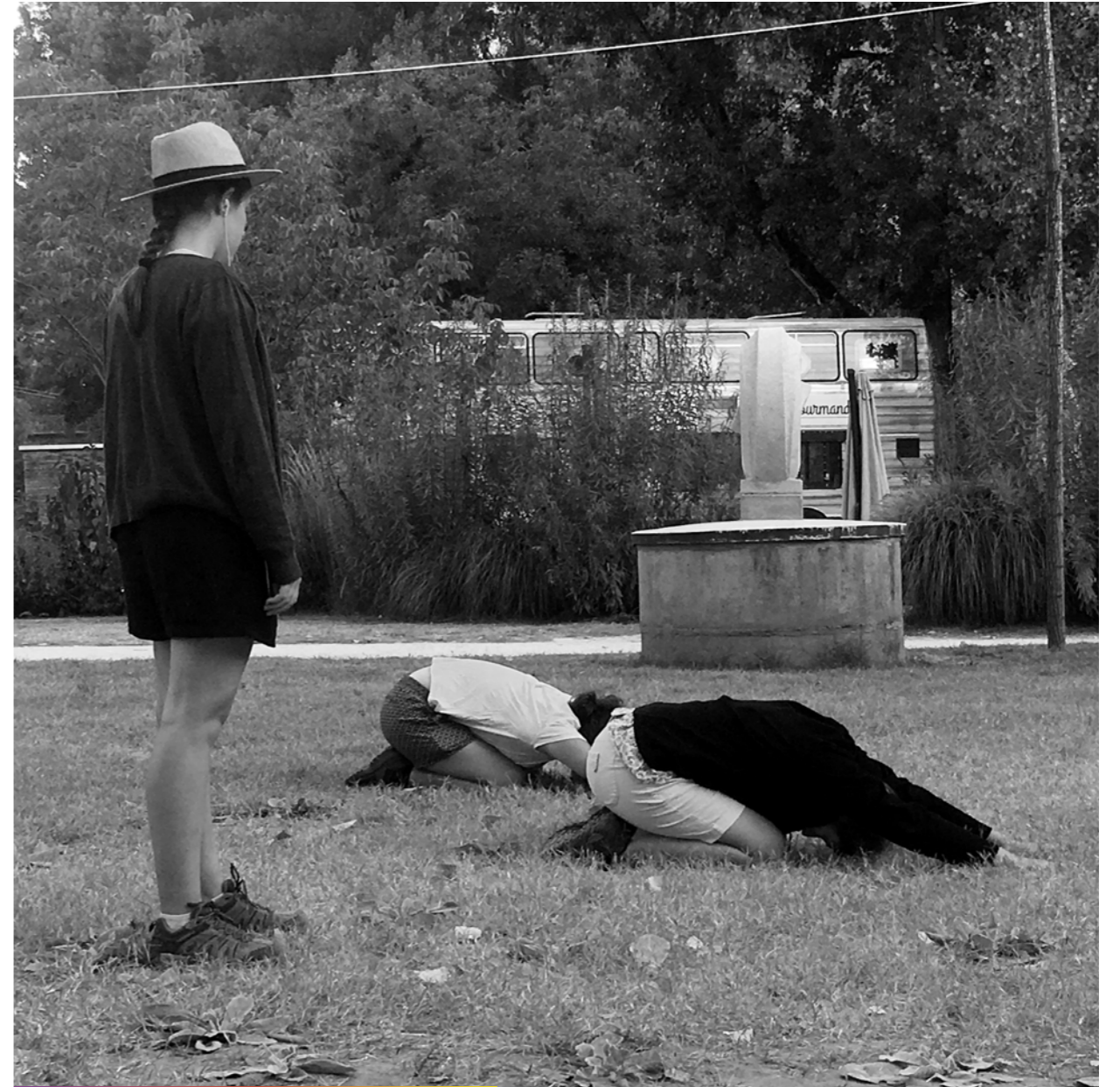
Prière de ne pas marcher sur le gazon.