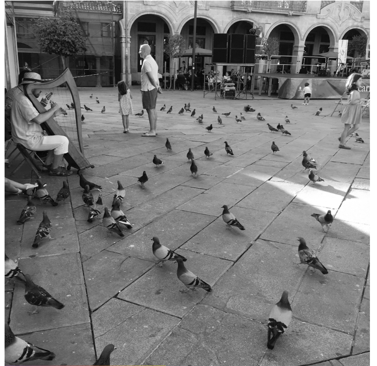
Un musicien qui joue «à pigeon vole».