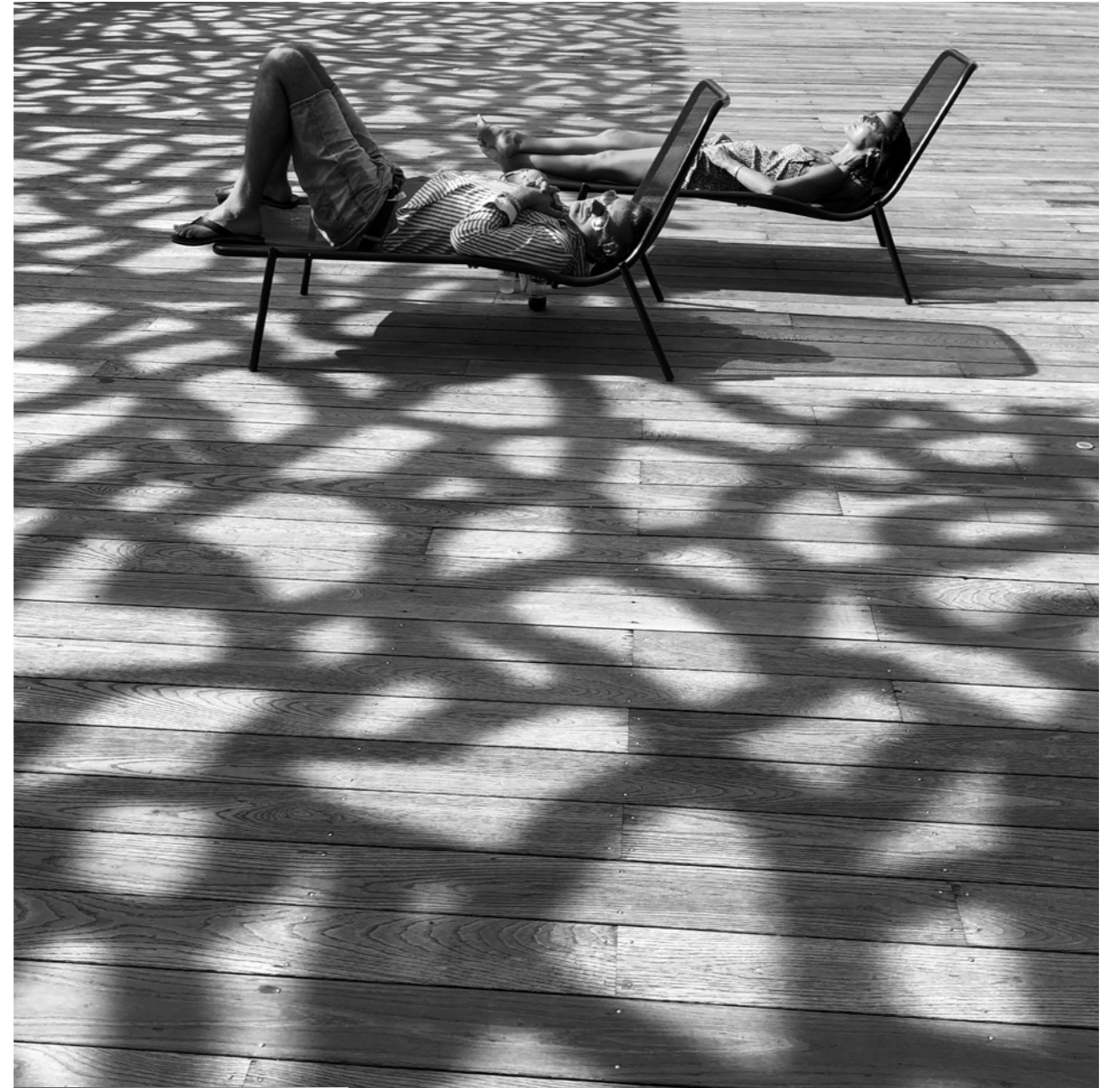
Le syndrome de la girafe.