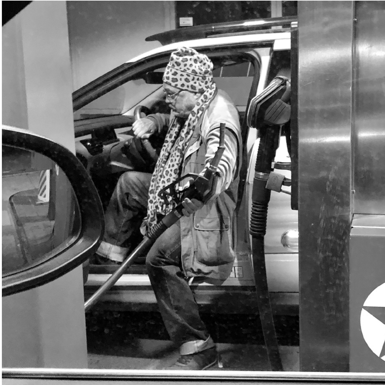
Revendication des bonnets à pois sur les prix du carburants : on ne lâchera rien!