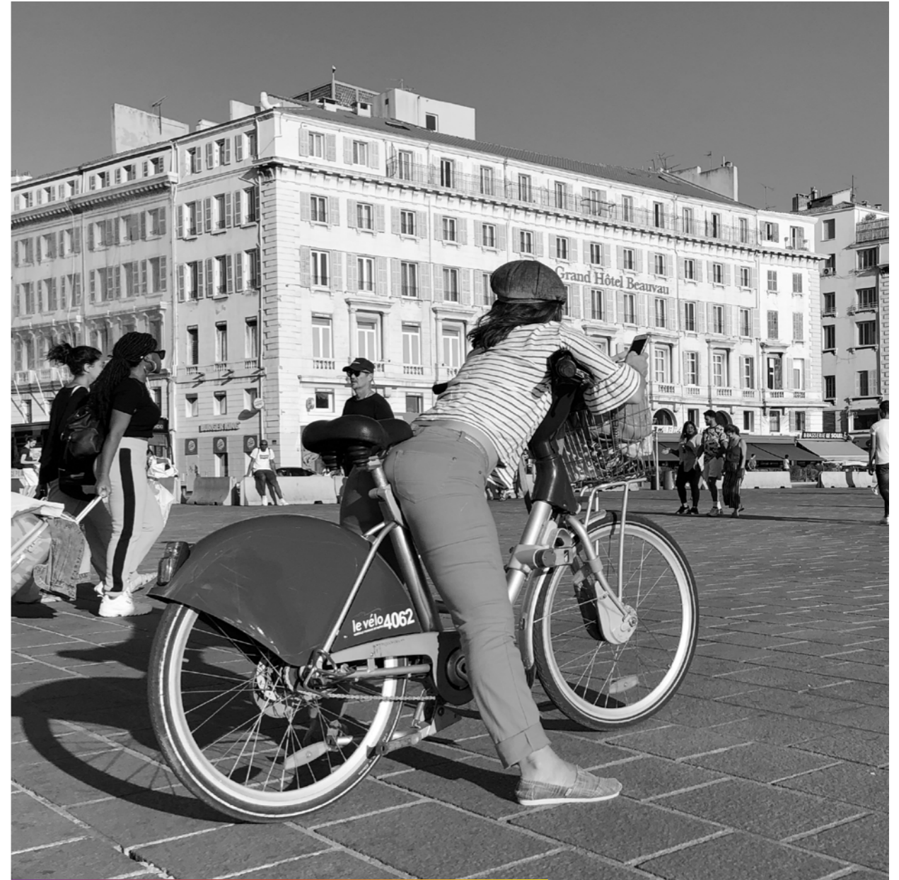
L'étirement du cycliste, idéal pour envoyer des textos.