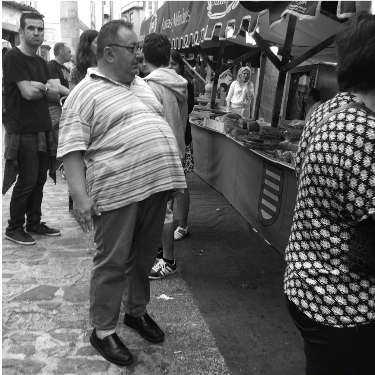
- Pour ne pas craquer, je prends ma respiration.