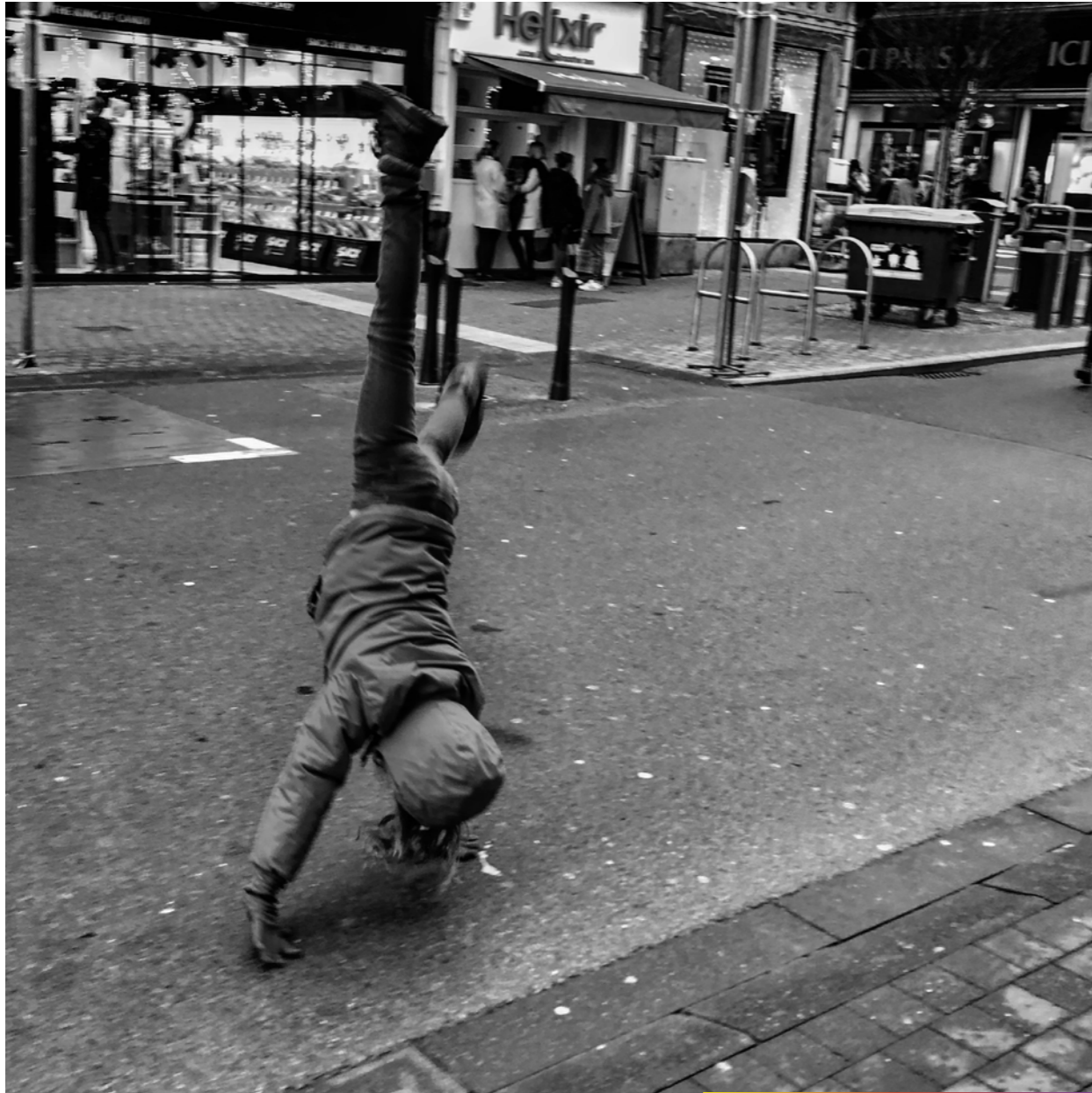
- Moi aussi je peux faire la rue!