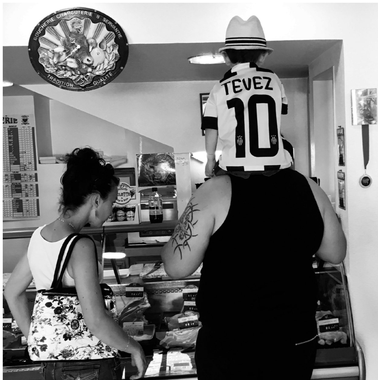
- Mais où ai-je la tête?