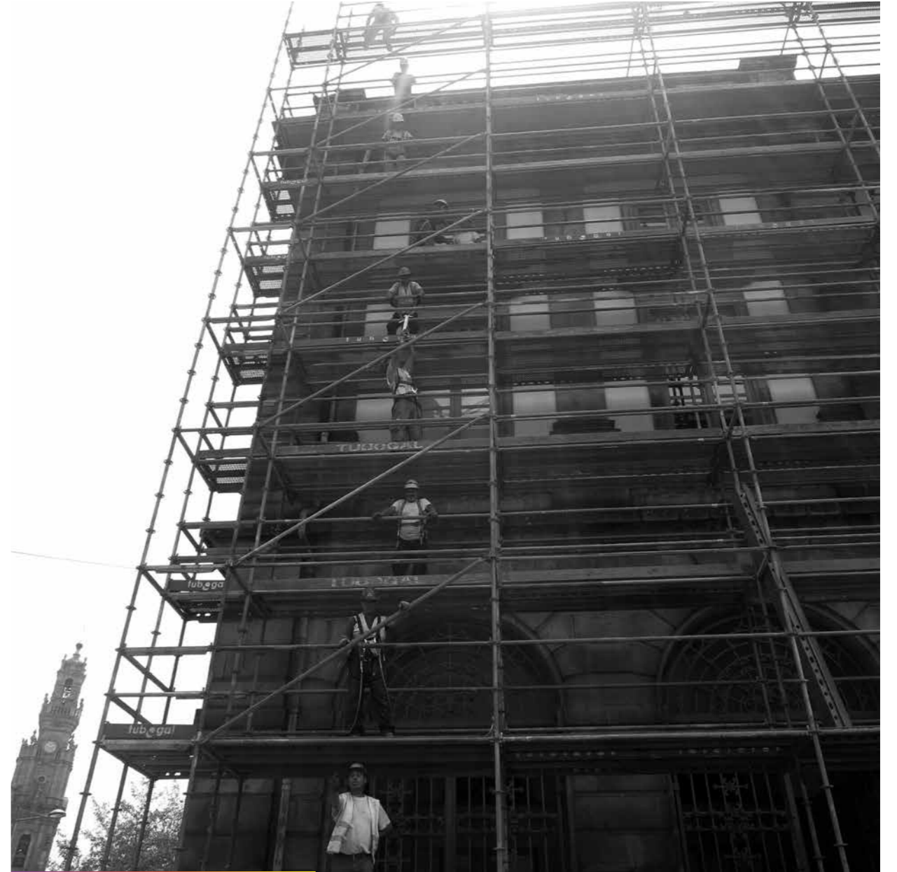
Gardez la ligne s'il-vous-plait!