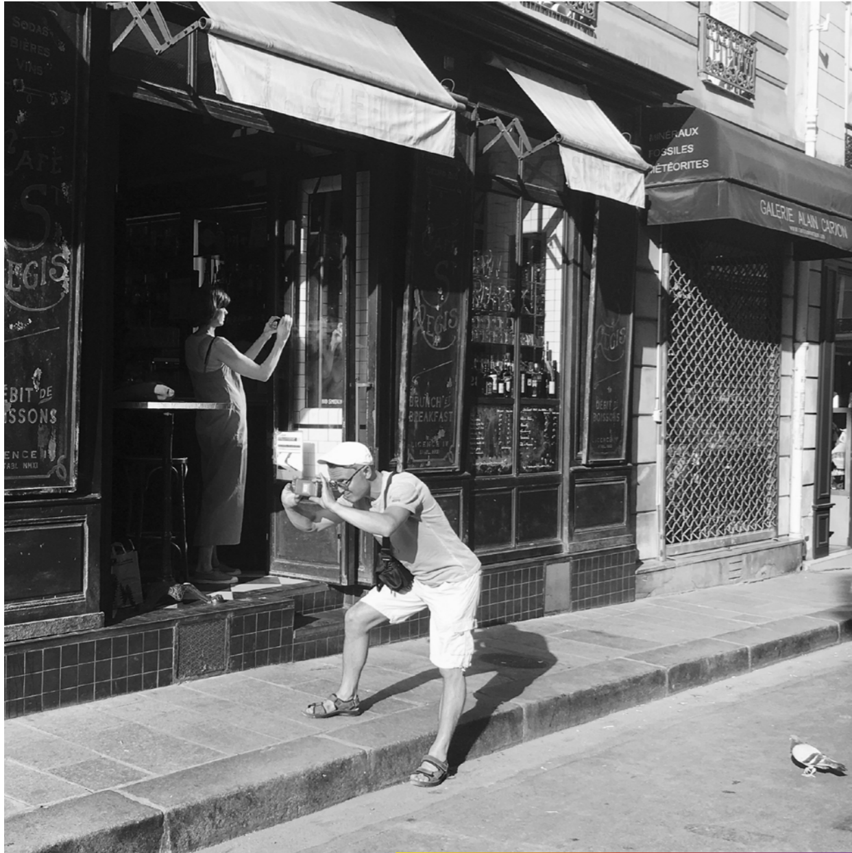
Attention, le petit oiseau va sortir (du champs)!