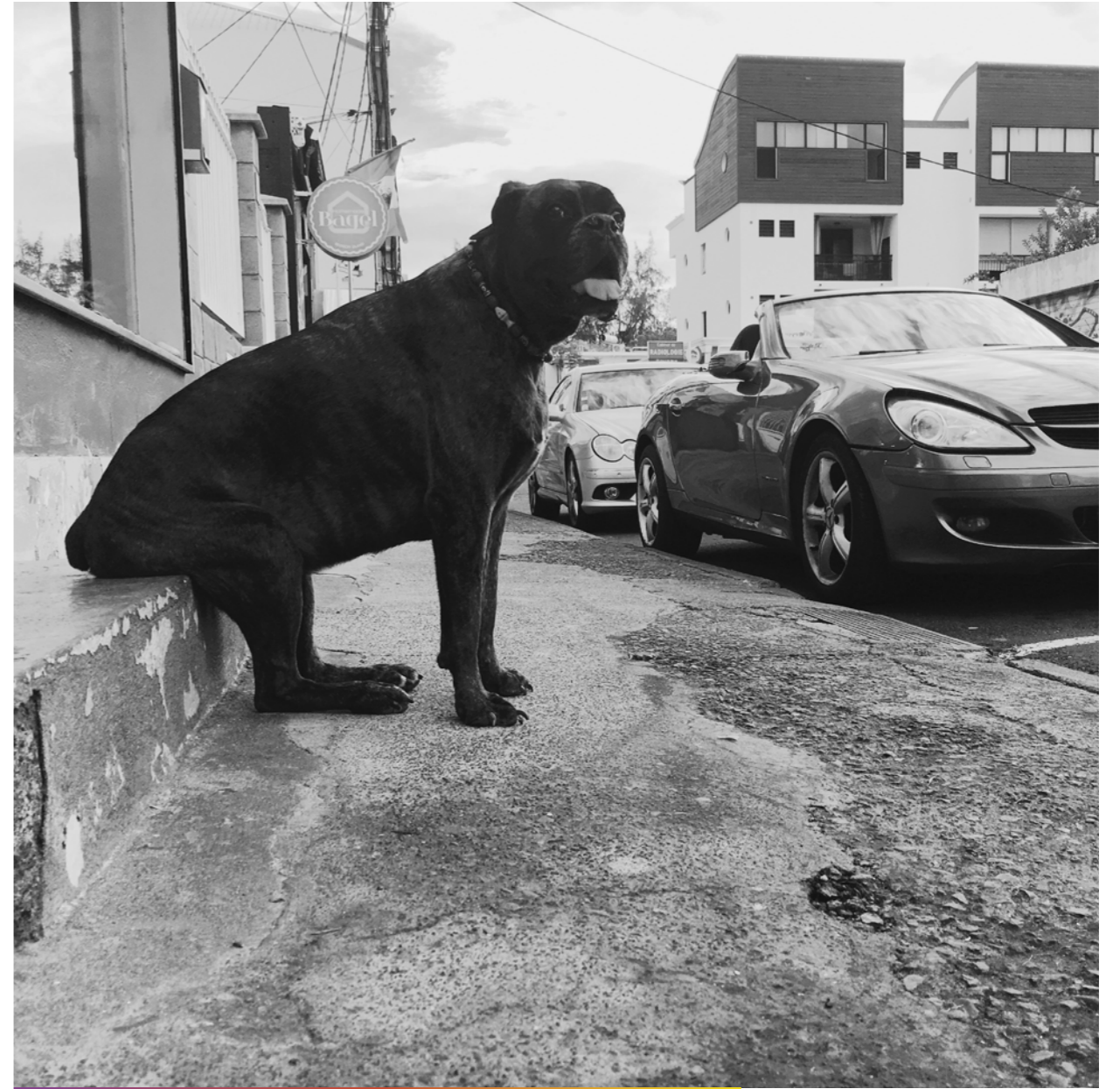
Quand vous dites «Assis!» à un chien, il y en a qui écoutent.