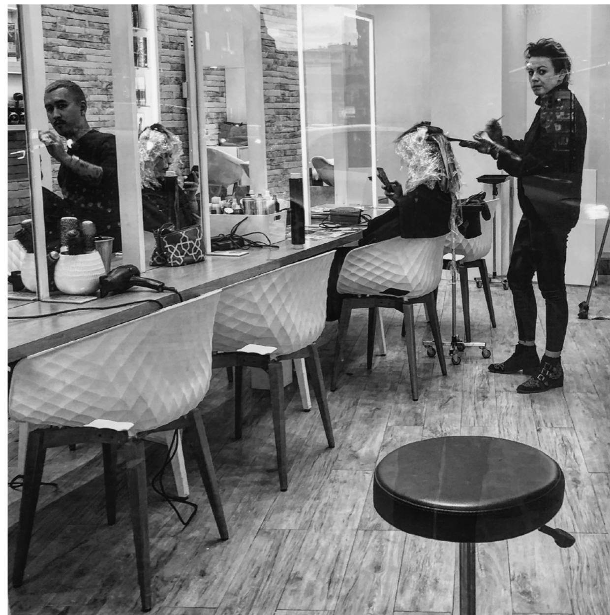
- Ça vous la coupe, ma nouvelle coiffure, hein?