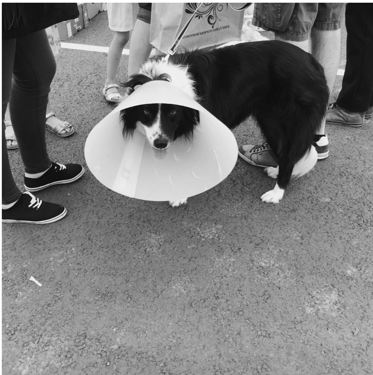
Quand votre chien a une extinction de voix, il existe un amplificateur d'aboiments.