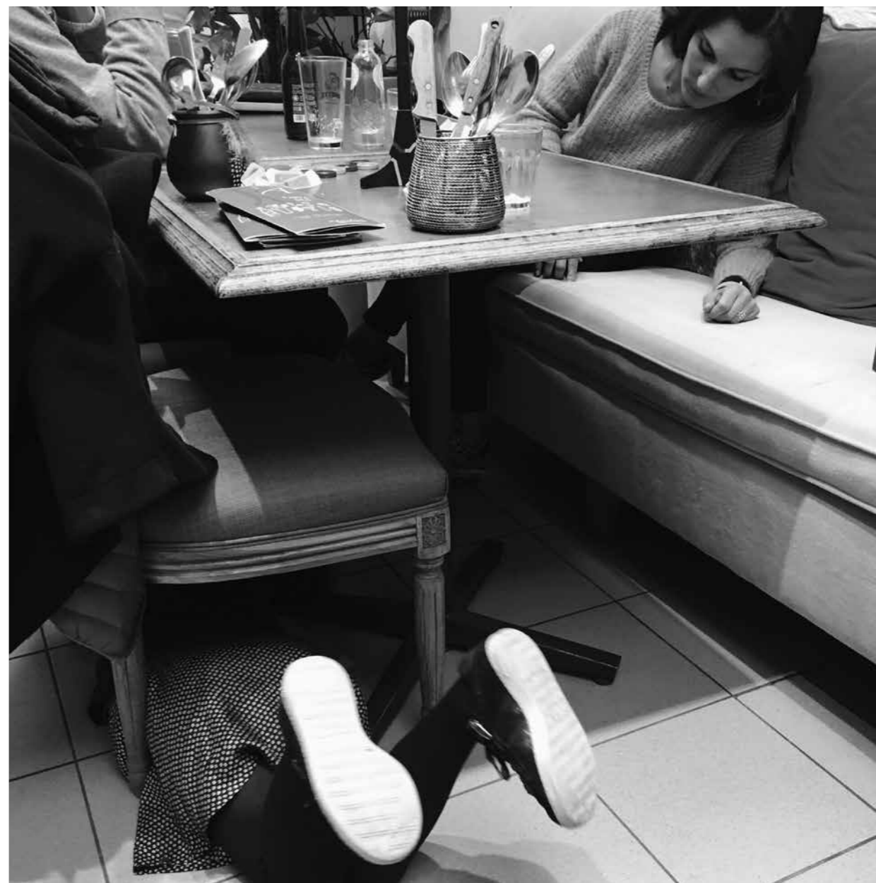
- Arrête de tirer sur les lacets de papa, ça ne se mange pas!