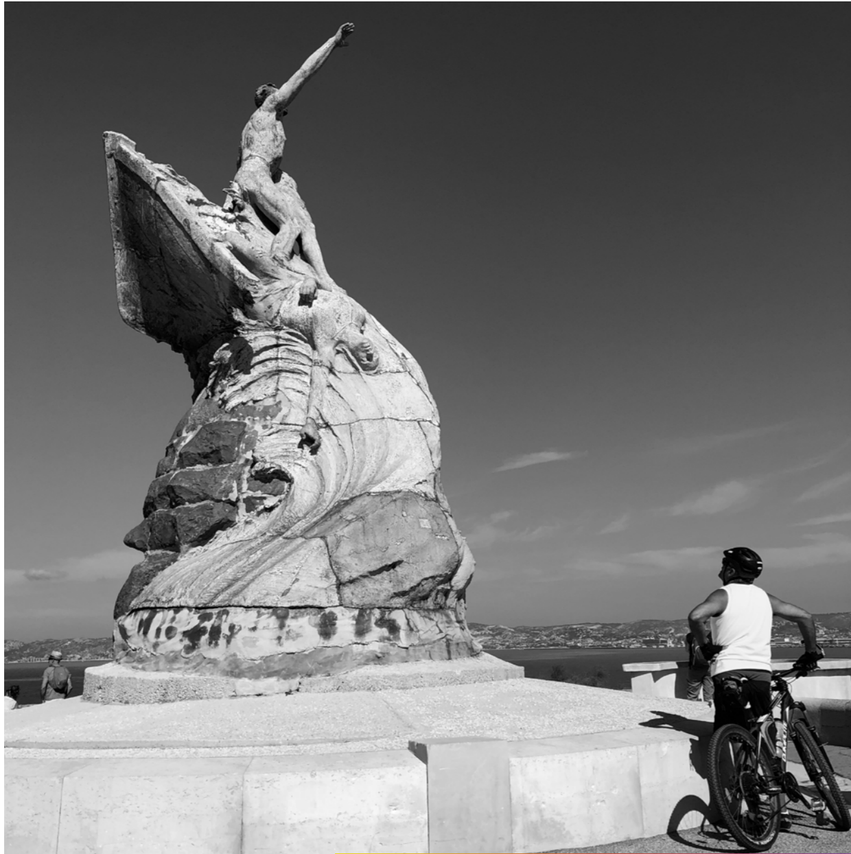
Quand le sage désigne la lune, l'idiot regarde le doigt.