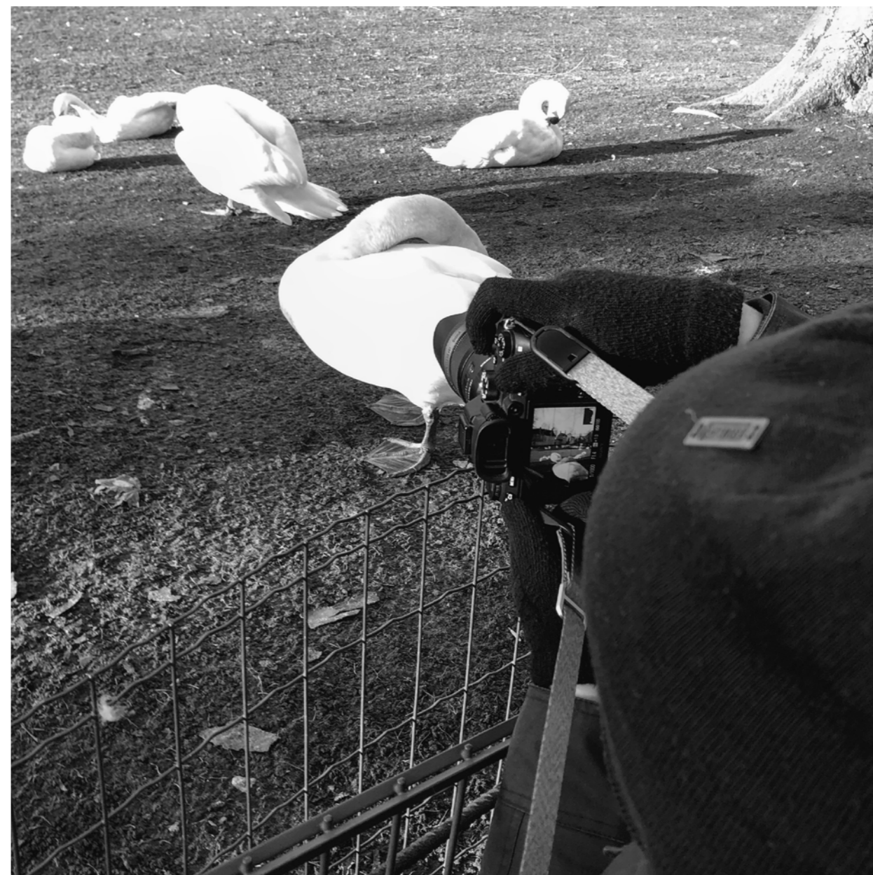
Il suffira d'un cygne, un matin in in in!