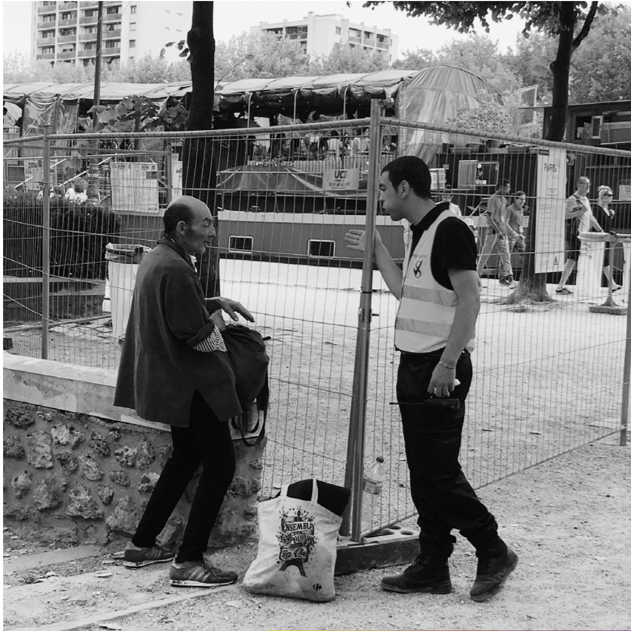
- Si j'vous fait le Moon Walk, vous m'laissez rentrer?