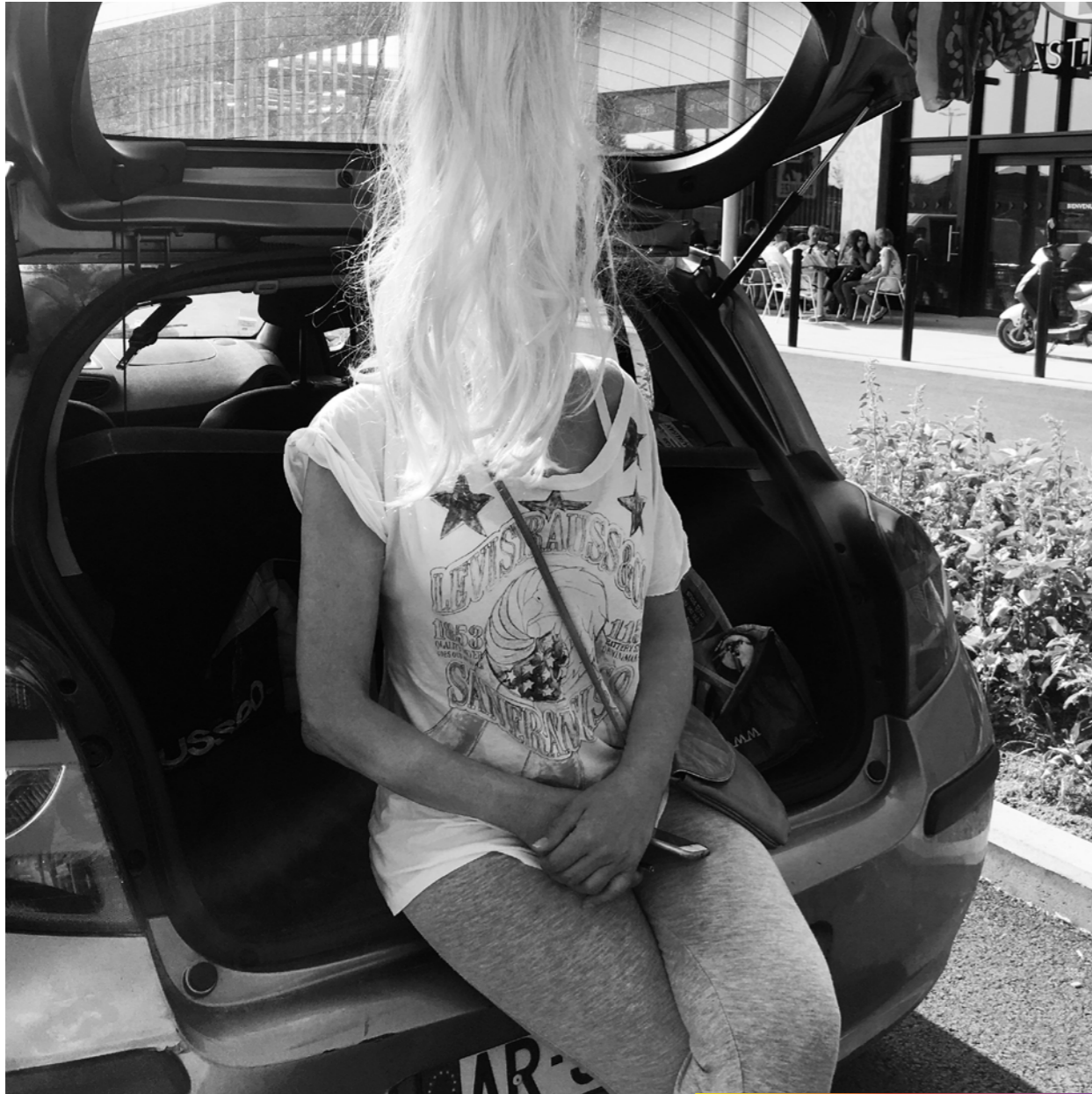
Voici la Coupe du Monde 2018.