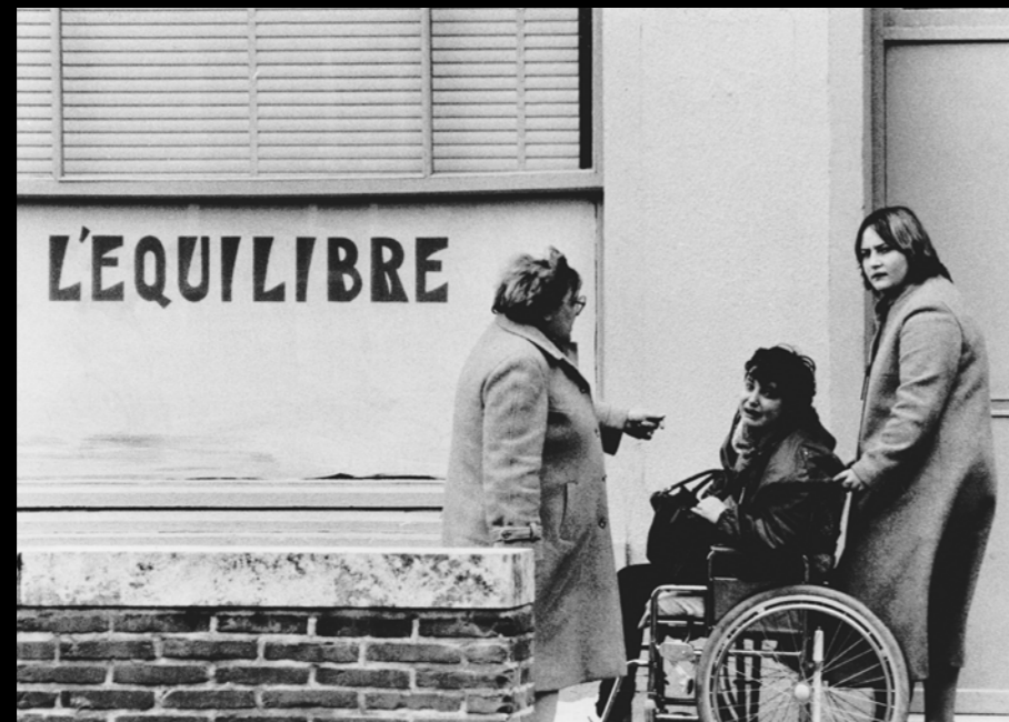
Bruxelles / 1979 / Nikon F3 / Film argentique