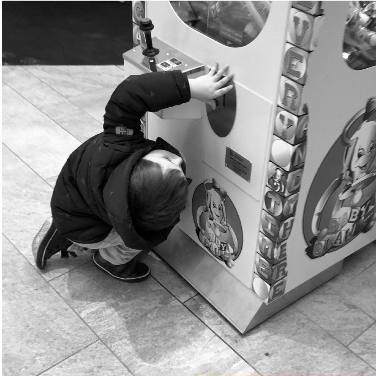
- Mamaaaaaan, j'arrive pas à l'attrapeeeeeer!