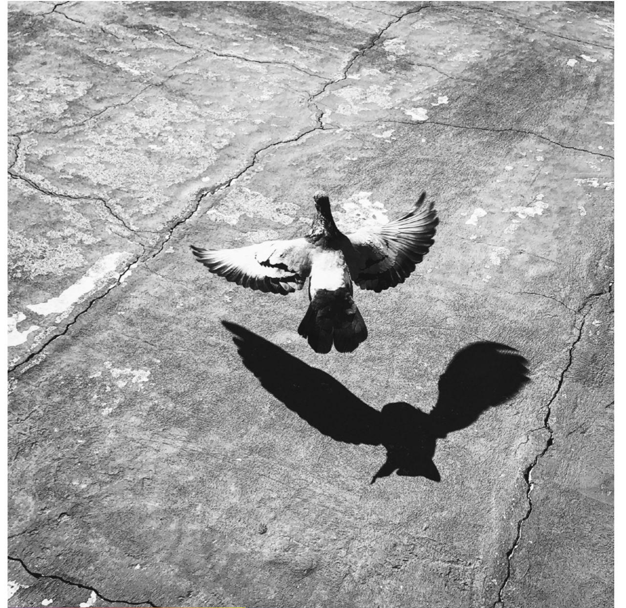
- Revient gamin, c'était pour rire!