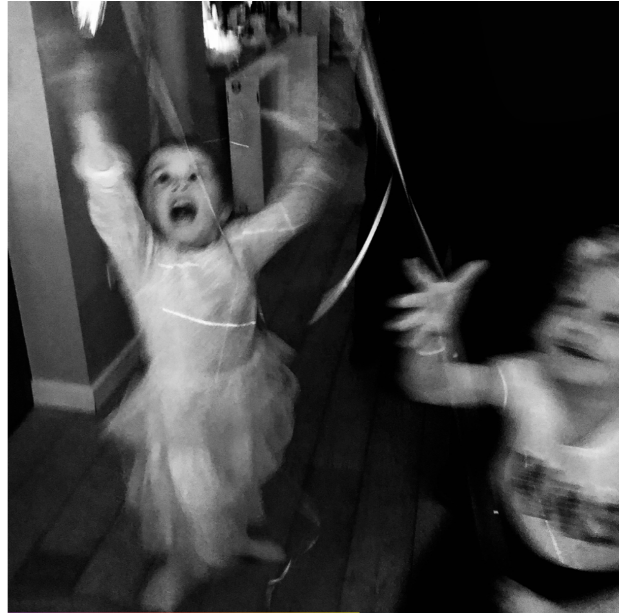
Premier jour de l'année: les enfants sautent de joie.