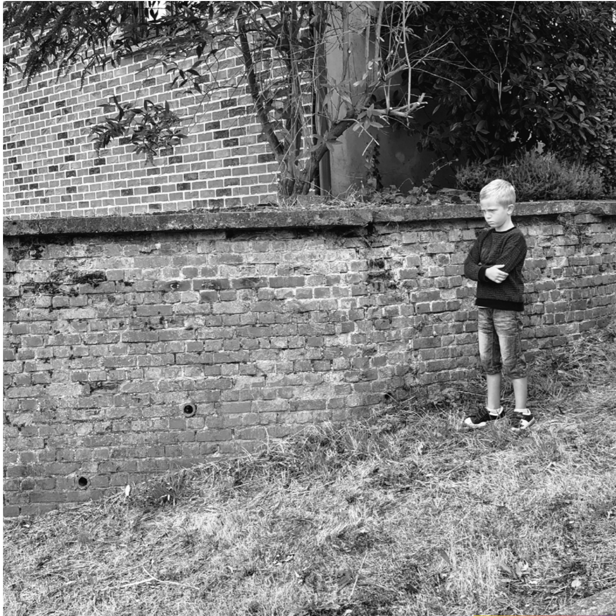
- Je veux une PS4!