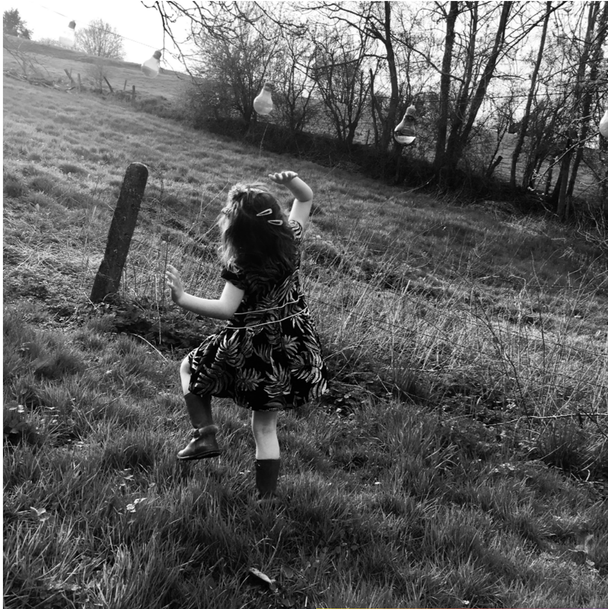
- En partant, n'oublie d'atteindre la lampe!