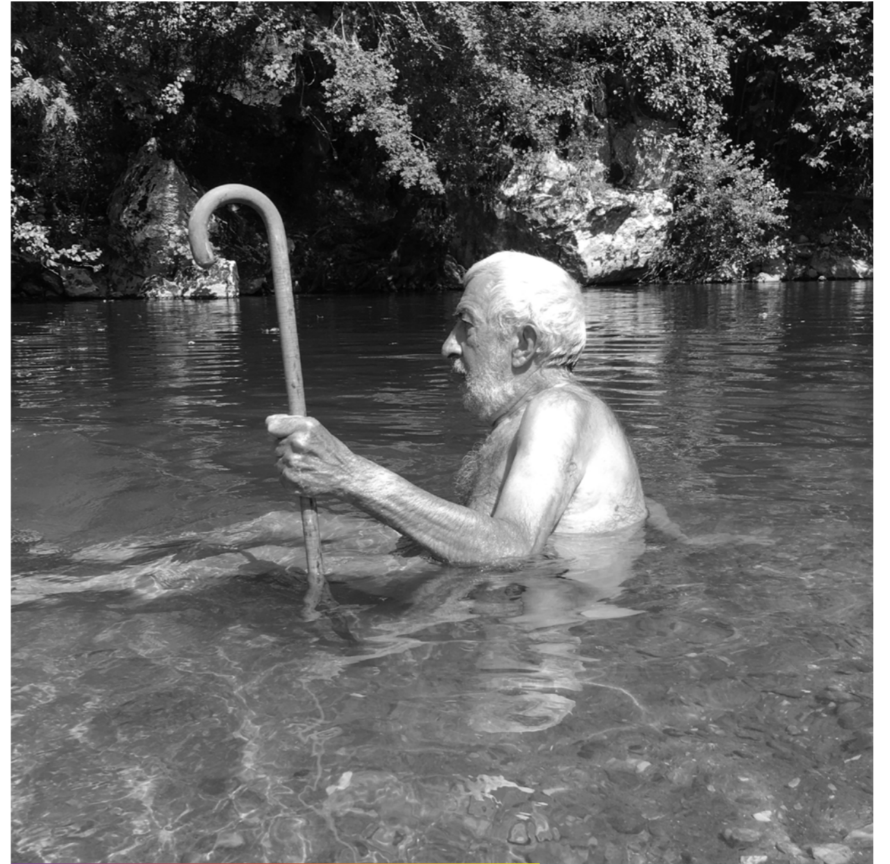
Saint-Nicolas a aussi le droit de prendre des vacances.