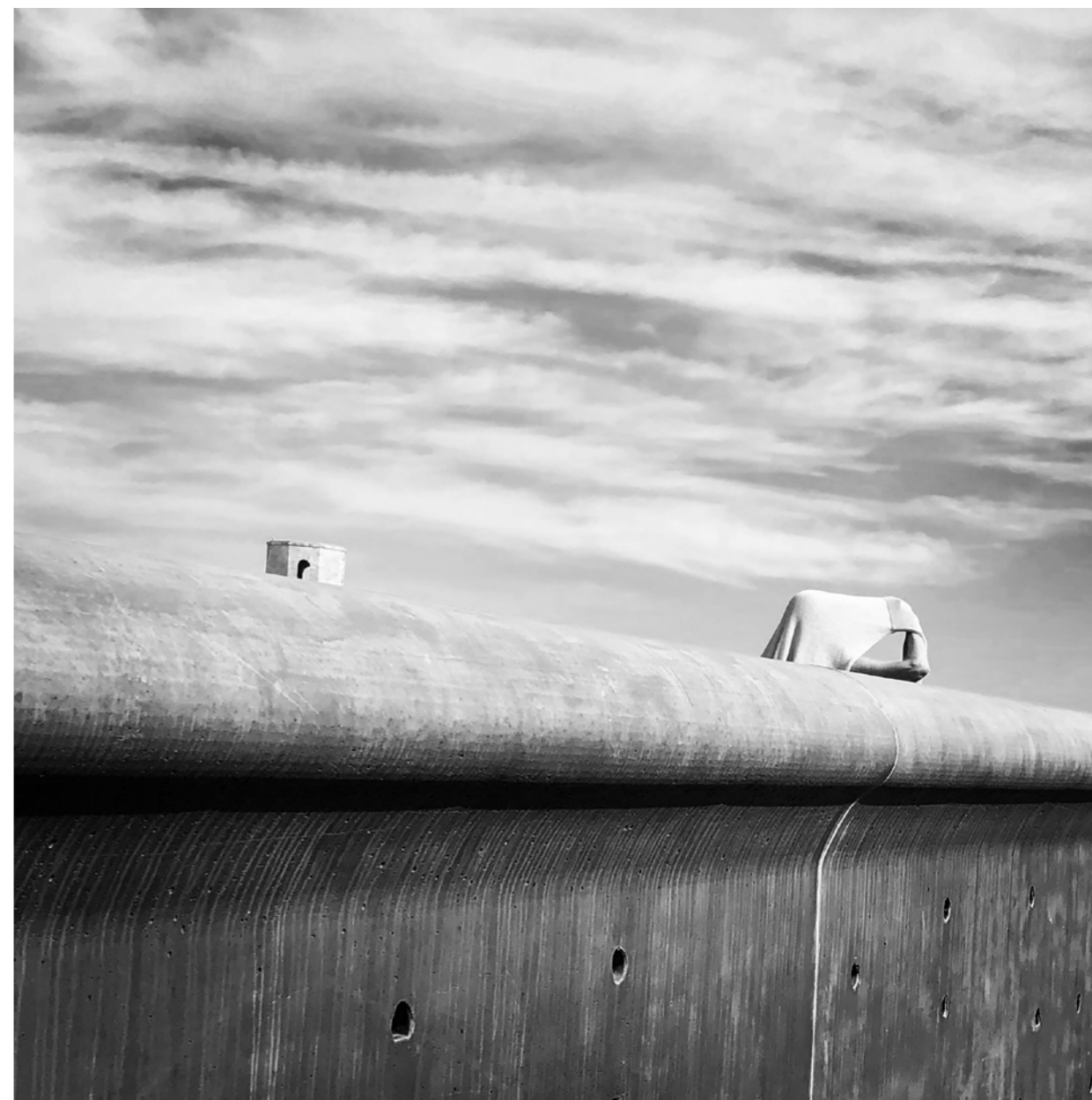
La passerelle du Mucem. Temps couvert.