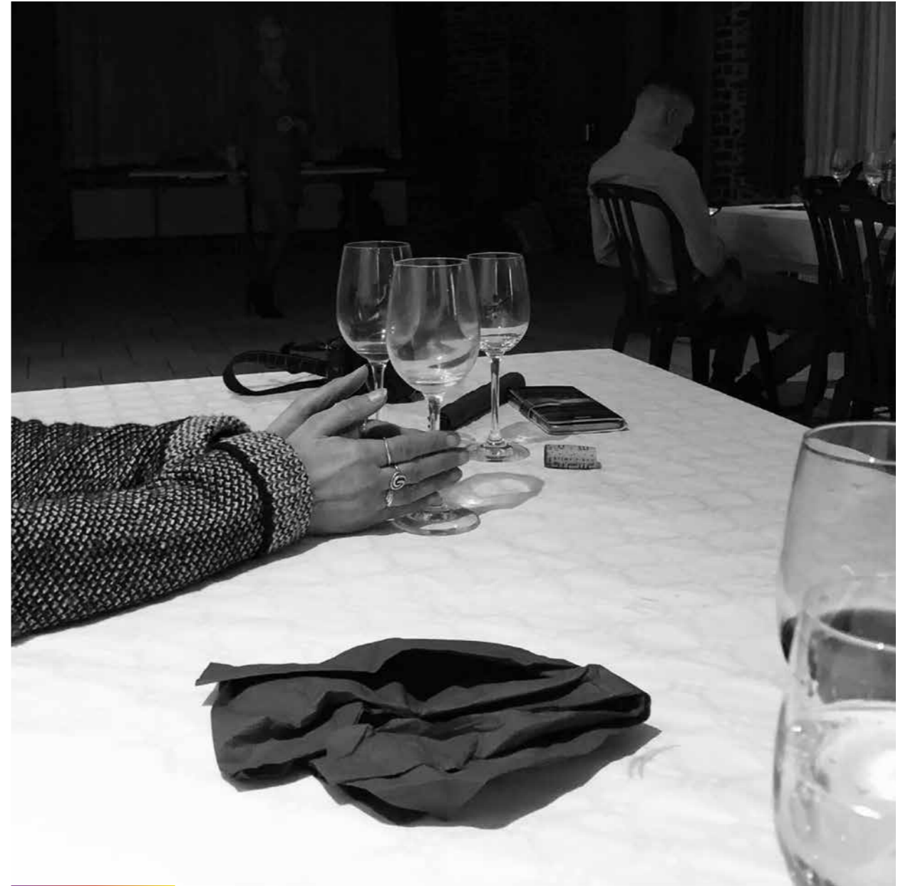
Fin de soirée.