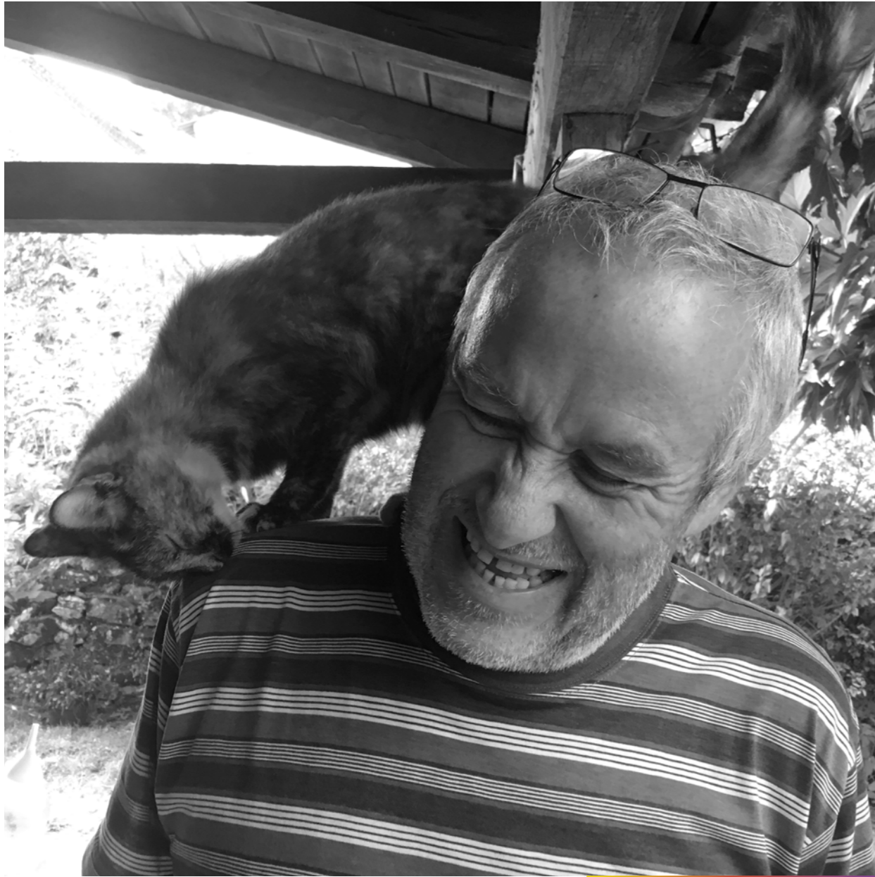
Qui s'y frotte s'y pique fort.