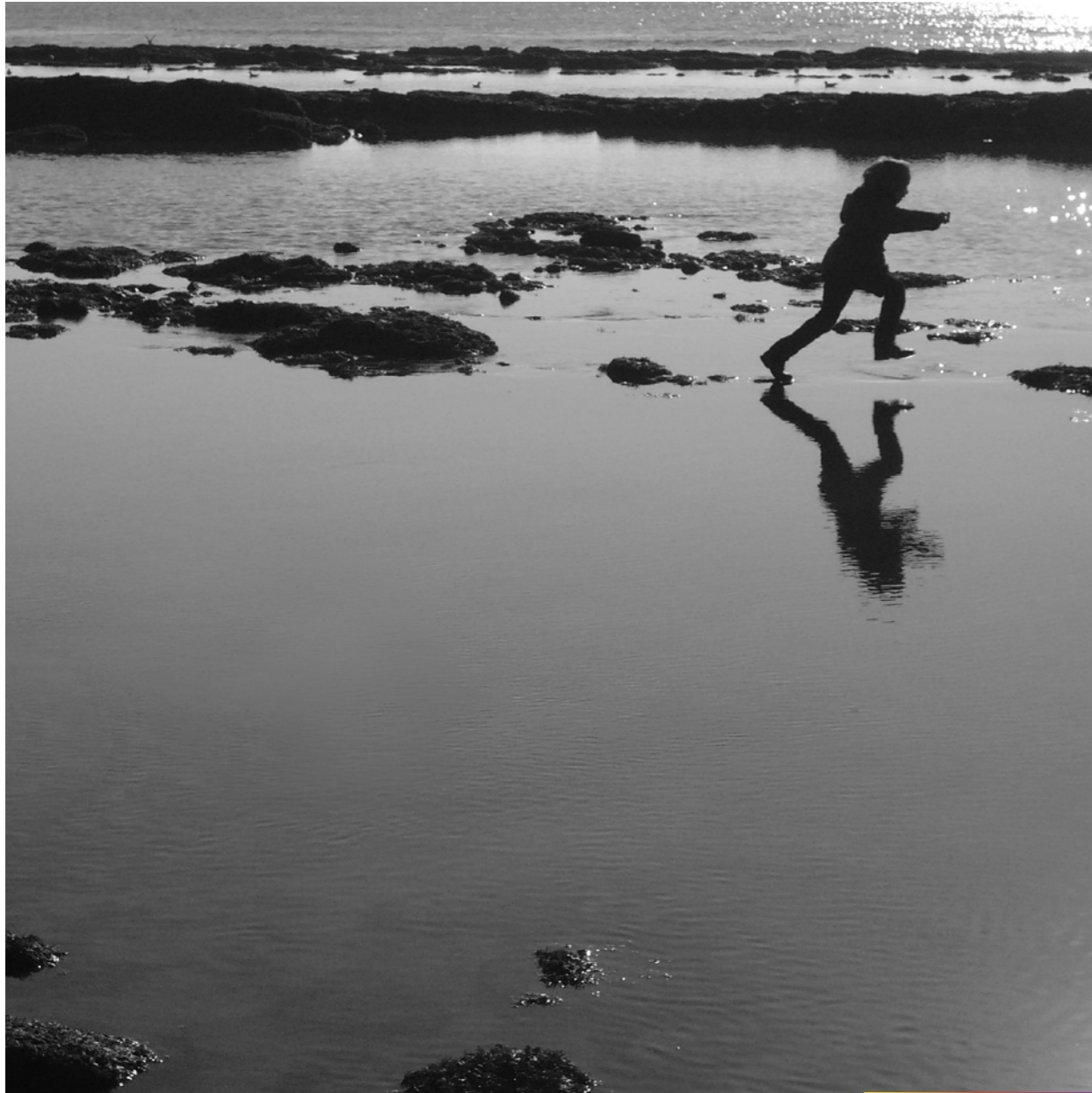
Un saut de plus.