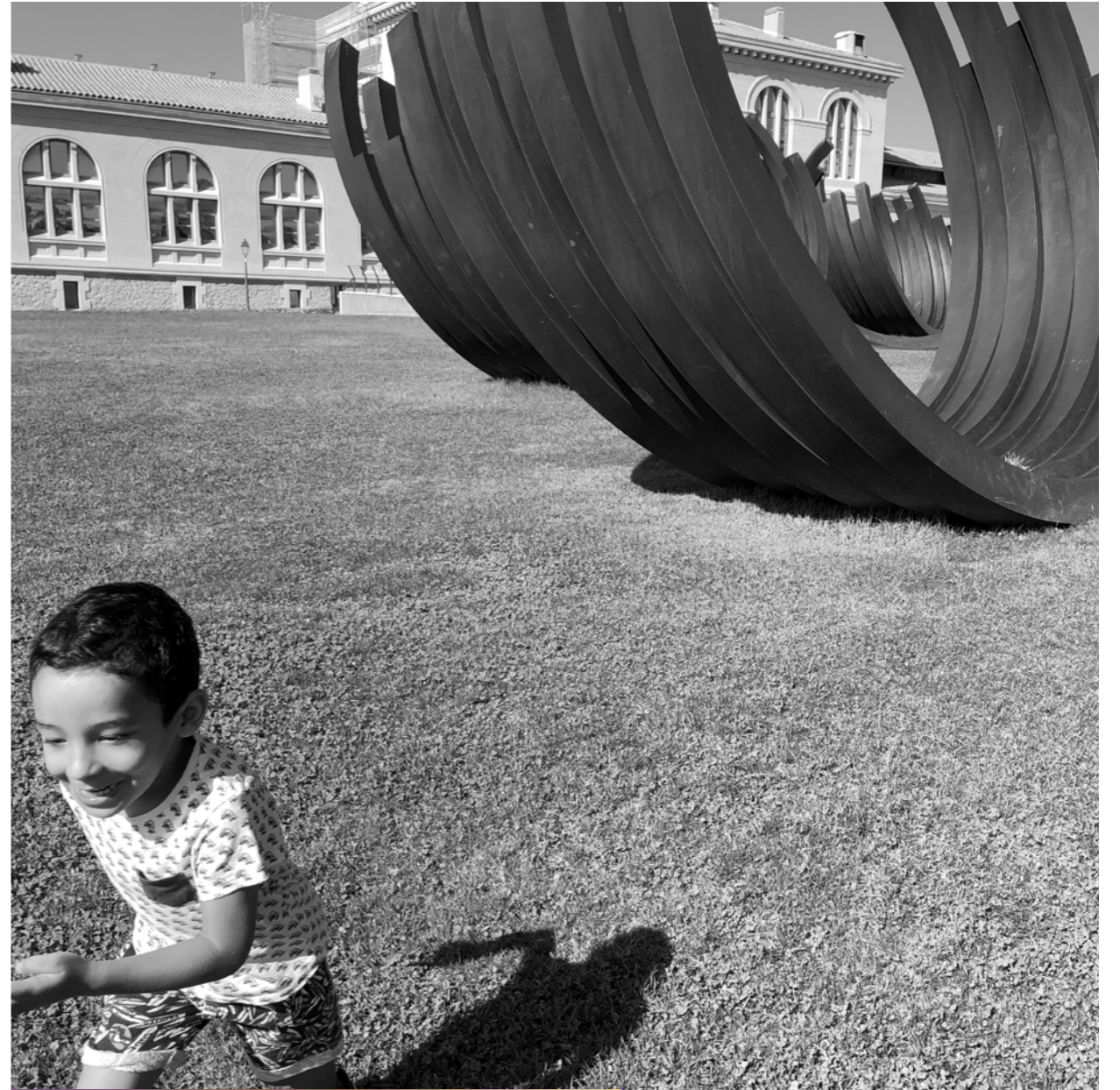
Catch me if you can [ Cours après moi si tu peux ].